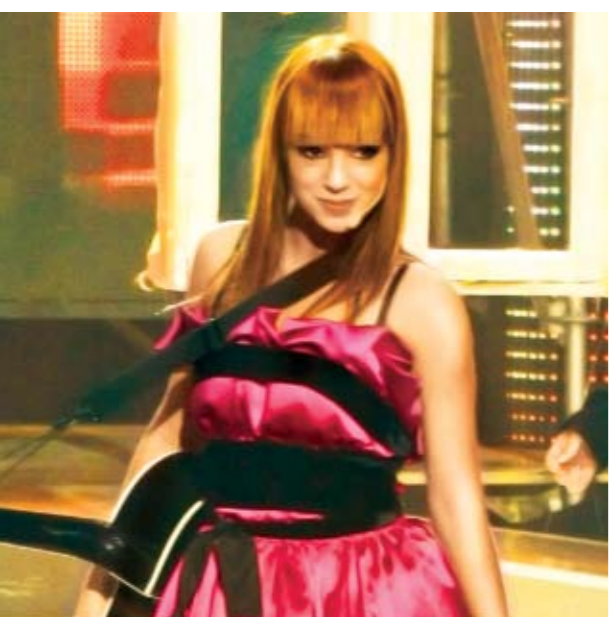
Для Аліси головне — отримати похвалу батька.